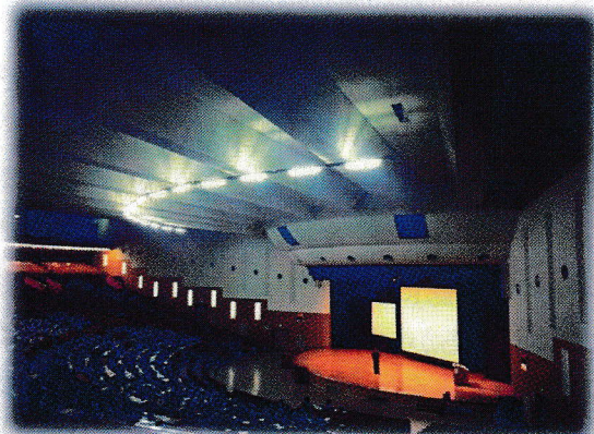
※講習会の会場 1500人収容可能